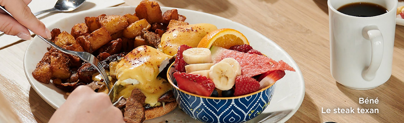
Béné Le steak texan