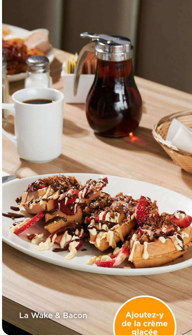
La Wake & Bacon

Ajoutez 2 oeufs brouillés dans la crêpe + 2,50 $