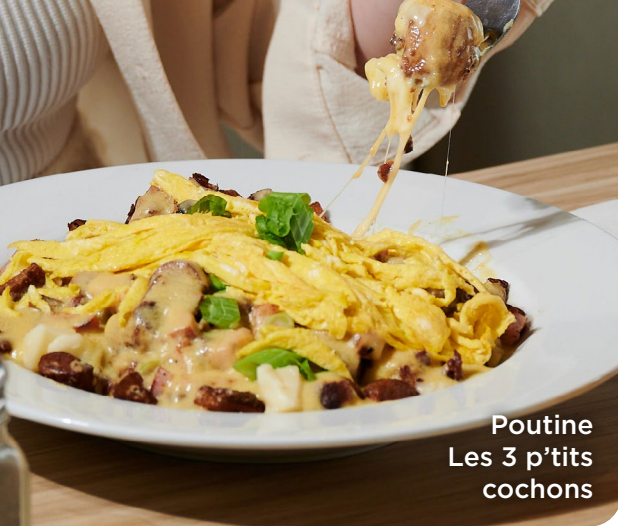
Poutine Les 3 p'tits cochons