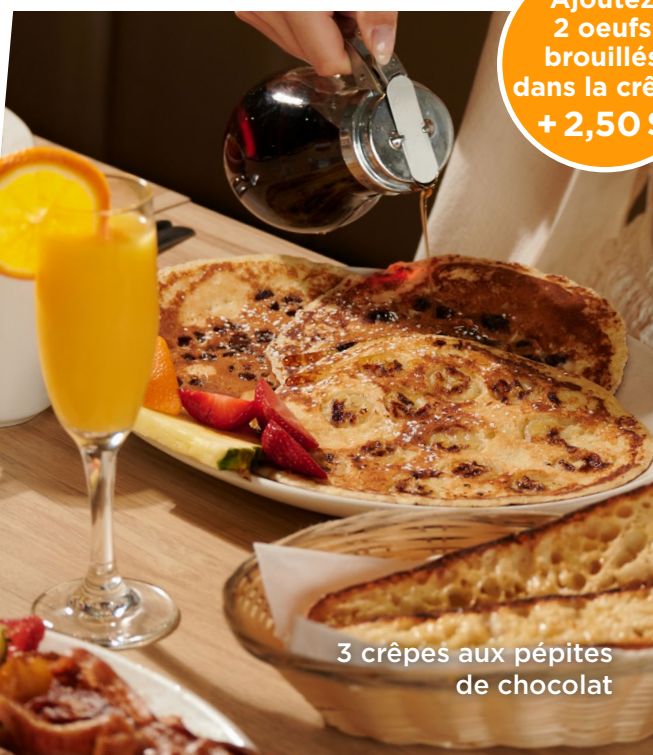
3 crêpes aux pépites de chocolat

*Un extra s'applique pour certaines substitutions.