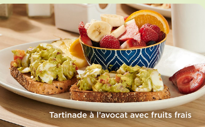
Tartinade à l'avocat avec fruits frais

Le brie fondant 18 50 Brie, oignons caramélisés, miel et noix sur muffin anglais. Servi avec fruits frais