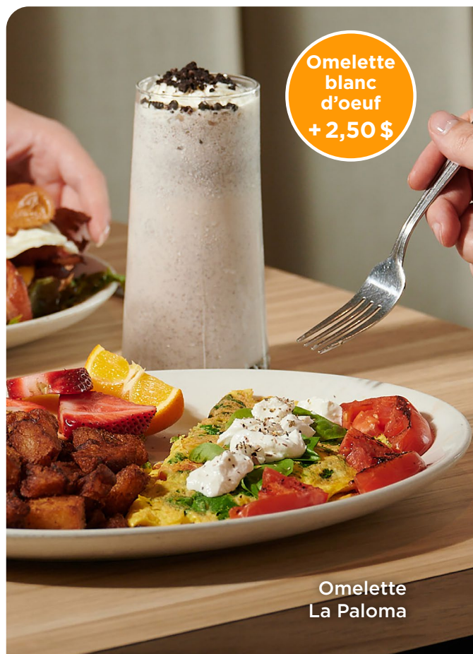
Omelette blanc d'oeuf +2,50 $

Changez vos pommes de terre en mini poutine (+3,50 $) ou mini poutine au bacon (+4 $)