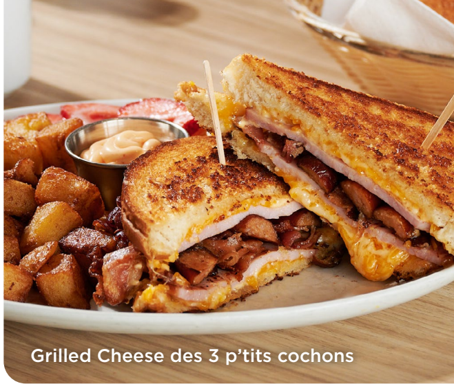
Grilled Cheese des 3 p'tits cochons

Grilled Cheese des 3 p'tits cochons 18 25 Bacon, jambon, saucisse, fromage et mayo épicée